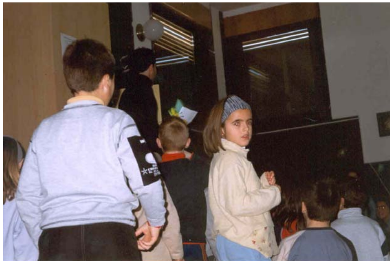
Foto nº2: Una gran part del temps de cada exposició ha de reservar-se a respondre la multitud de preguntes sobre els voltors que ja sobrevolen els seus col·lègis.