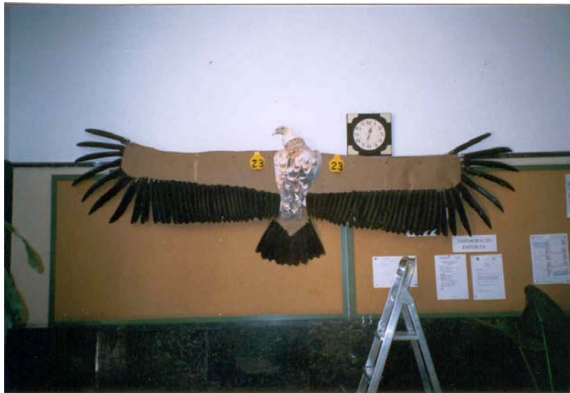
Foto nº1: Una maqueta a escala, realitzada a partir de plomes d'un voltor, permet a xiquets i xiquetes apreciar a l'interior de les aules el tamany d'una d'aquestes aus.