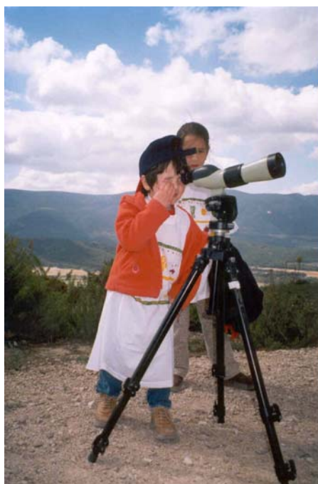
Foto nº3: Les visites al canyet fascinen als escolars que visiten les instal·lacions.